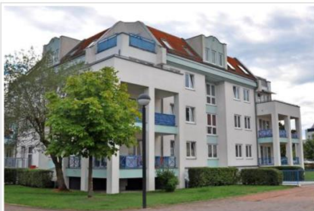
273 Wohn- und vier Gewerbeeinheiten in der Rote-Mühle-Siedlung profitieren von der neuen Wärmeversorgung.

Popp. Dabei stand auch fest, dass „die Umstellung der Wärmeversorgung kostenneutral für die Mieter erfolgt“, so Popp.